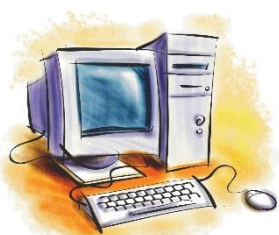
PRÁCOVAT S POČÍTAČEM