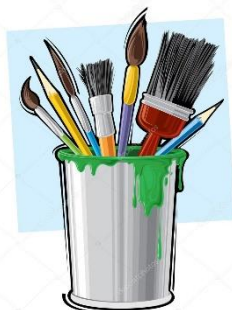
TVOŘIT / VYRÁBĚT