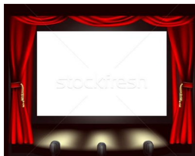
NAVŠTÍVIT KULTURNÍ ZAŘÍZENÍ