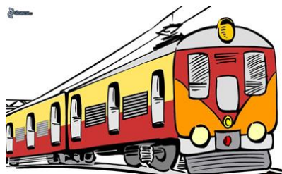
JEZDIT NA VÝLET