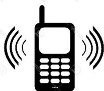
ZACHÁZET S MOBILNÍM TEL.