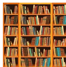
CHODIT DO KNIHOVNY