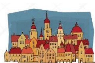
ORIENTOVAL SE VE MĚSTĚ