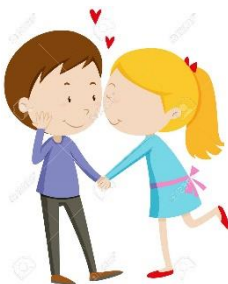
LÁSCE A PARTNERSTVÍ