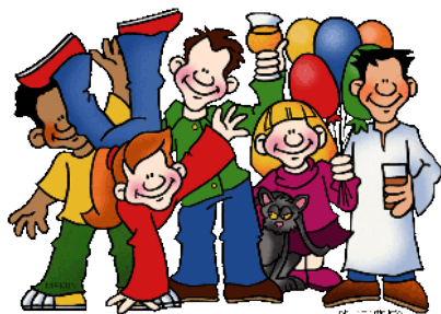
NAJÍT SI TU KAMARÁDY