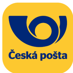
DOJÍT SI NA POŠTU