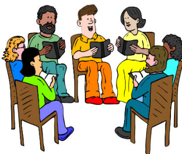
POVÍDAT SI O VŠEM MOŽNÉM