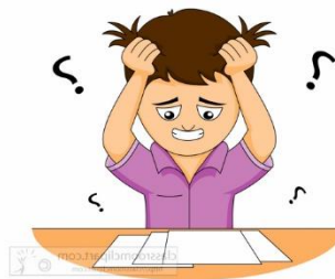
PORADIT, KDYŽ SI NEVÍM RADY

KDYŽ SE ROZHODNETE CHODIT DO CDS, UZAVŘEME S VÁMI SMLOUVU.