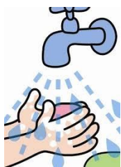
POMOC PŘI OSOBNÍ HYGIENĚ